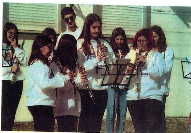
bandasdas musicais do concelho de Évora.

Esta iniciativa enquadra-se no “Mês de Março, Mês da Juventude”, que é organizado pela Câmara Municipal de Évora com o apoio da União de Freguesias e representa o importante trabalho desenvolvido a partir das diversas associações, agrupamentos e